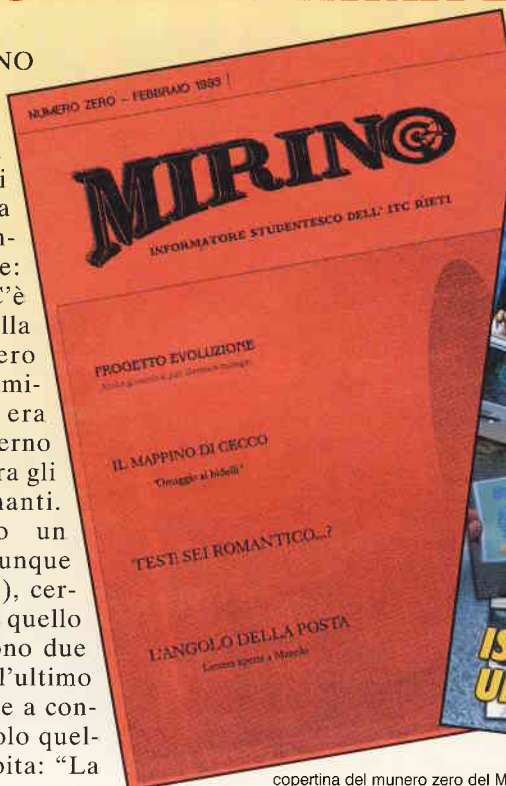
copertina del numero zero del MIRINO

Il secondo ha un lungo titolo-programmatico: "Guerre, petrolio e denaro: nella società del compromesso e dell'indifferenza c'è chi dice io non ci sto" ed è firmato da un compagno che ha terminato il corso di studi, Tomas Almaleck... Ebbene, anche se in uno stile e con toni diversi (smorzati il primo, accesi il secondo) i due articoli sono simili, impregnati dello stesso pessimismo esistenziale. Il denaro domina il mondo. Le guerre si fanno per il petrolio (come se potessimo fare a meno della benzina nei nostri motorini). Mi sembra che in dieci anni di giornalismo nessuno sia stato in grado di mostrarci una realtà economica, sociale e politica tale da suscitare in noi studenti uno stimolo in più per affrontarla con coraggio, ottimismo ma soprattutto con serenità. Tuttavia, un passo avanti nel nuovo Mirino c'è. Qui si parla di politica, delle difficoltà di realizzare i progetti per il miglioramento ambientale e sociale del Reatino. La politica non può fare a meno del pessimismo della ragione e dell'ottimismo della volontà. Ma neppure la vita può farne a meno. Bisognerebbe essere un pò più fiduciosi nell'avvenire ma soprattutto più ottimisti. Un'ultima osservazione: perché